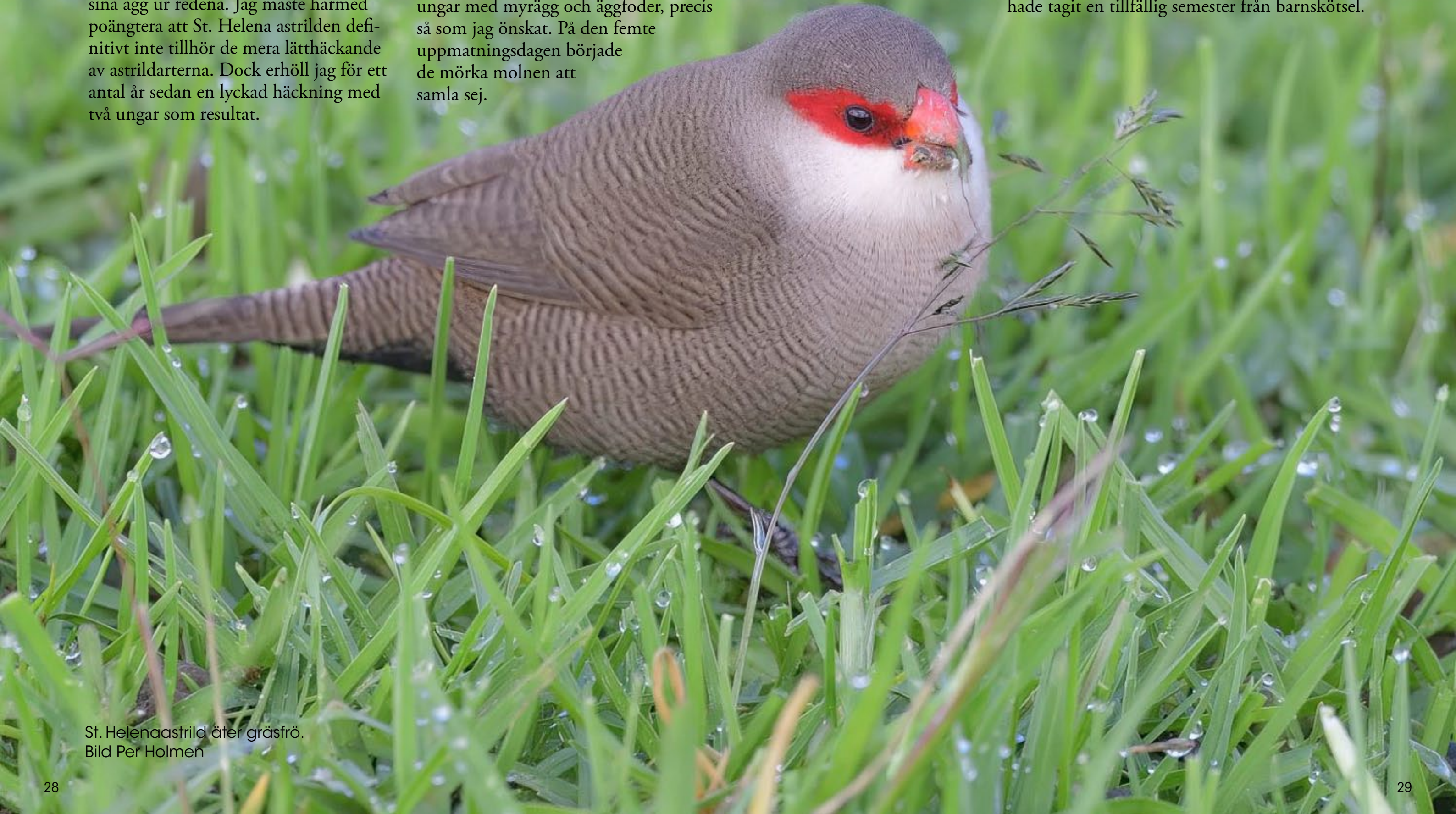
St. Helenaastrild äter gräsfrö.

Föräldrarna slutade helt sonika att mata sina ungar. Nu var god råd dyra. Tveklöst bytte jag St. Helenaastrildernas bokorg med måsfinkarnas, som för ovanlighetens skull inte innehöll vare sej ägg eller ungar. Dessa mycket produktiva fåglar, som nästan spottar ut ungar på löpande band, hade tagit en tillfällig semester från barnskötsel.