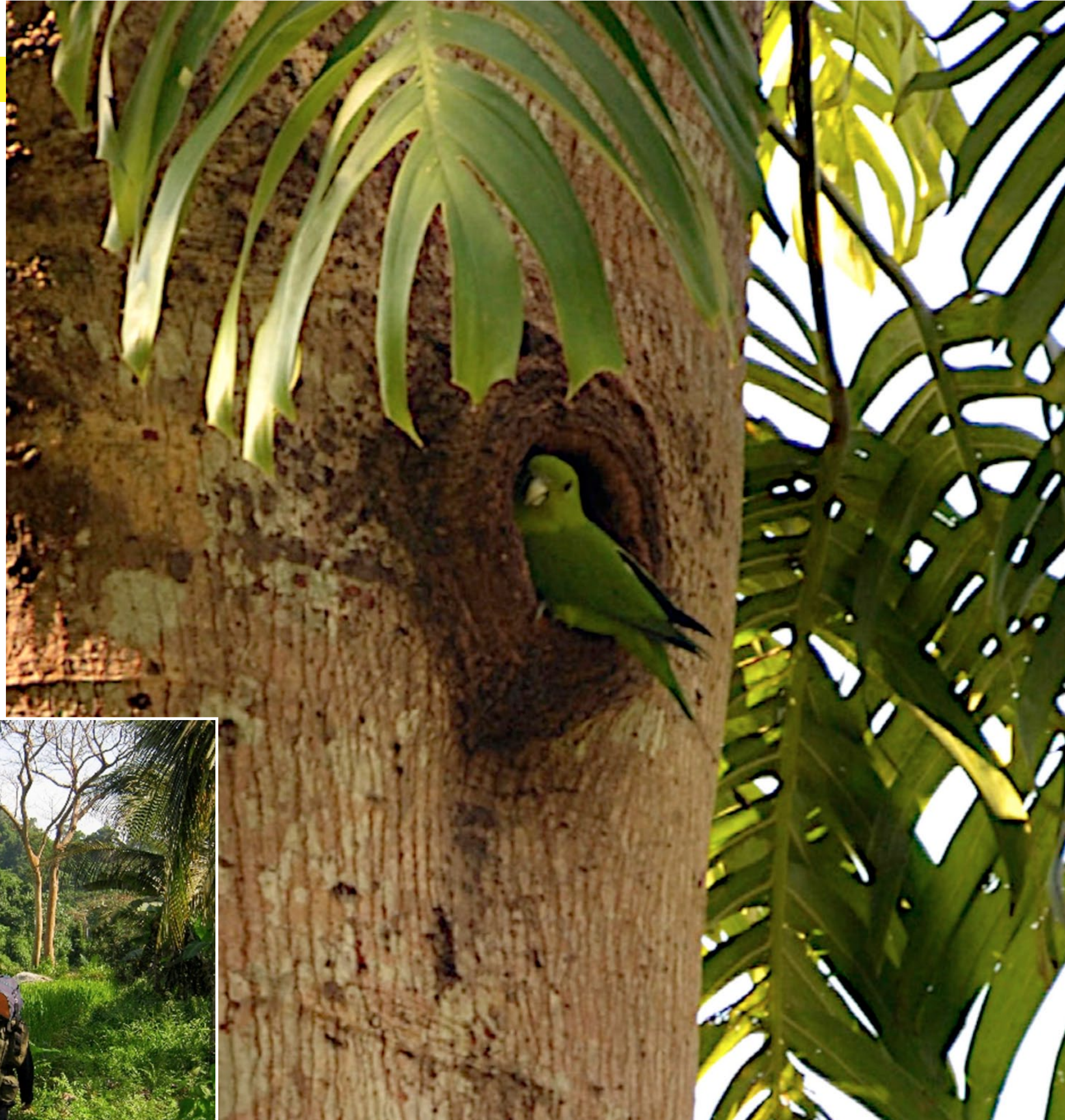
Grön racketstjärt vid sitt bo.