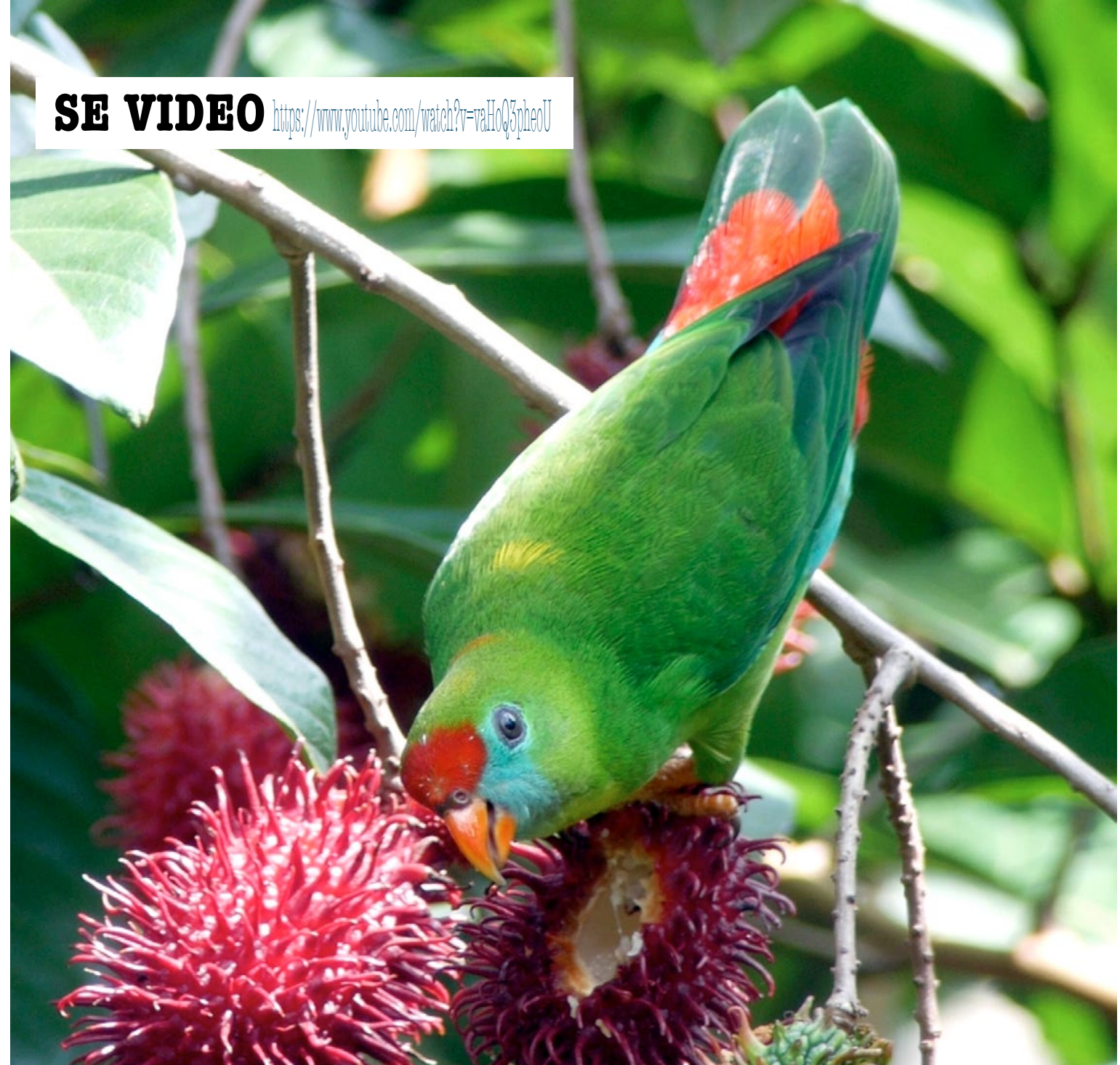
Filipinsk hängpapegoja, hona.

SE VIDEO https://www.youtube.com/watch?v=raHcQ3pbeoU