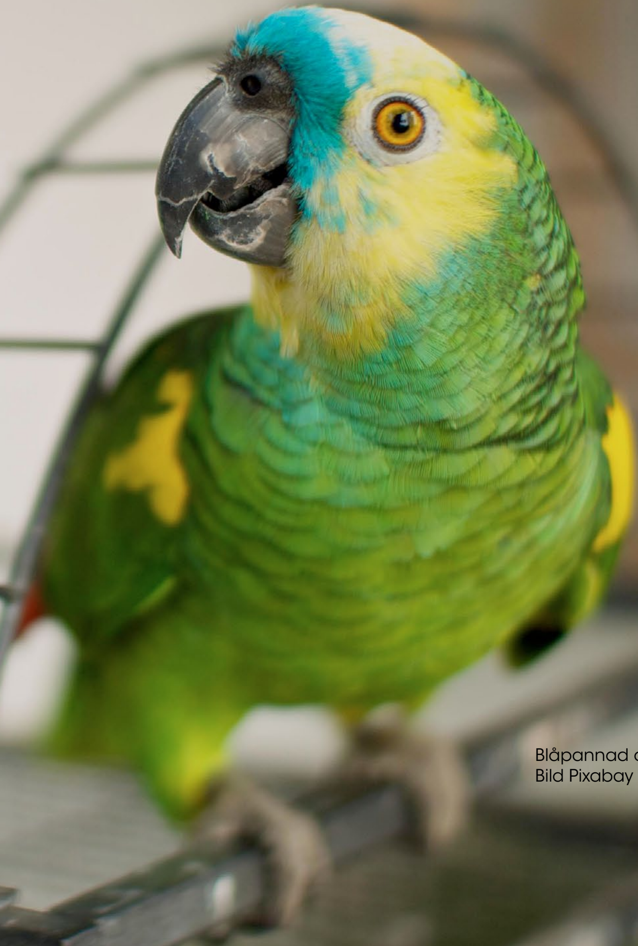
Blåpannad amason.

Vitamin E-brist är inte lika vanligt förekommande, men det kan ge encefalomalaci hos ungfåglar och försämrad reproduktion hos vuxna, speciellt aror (Wissink-Argilaga et al., 2015).