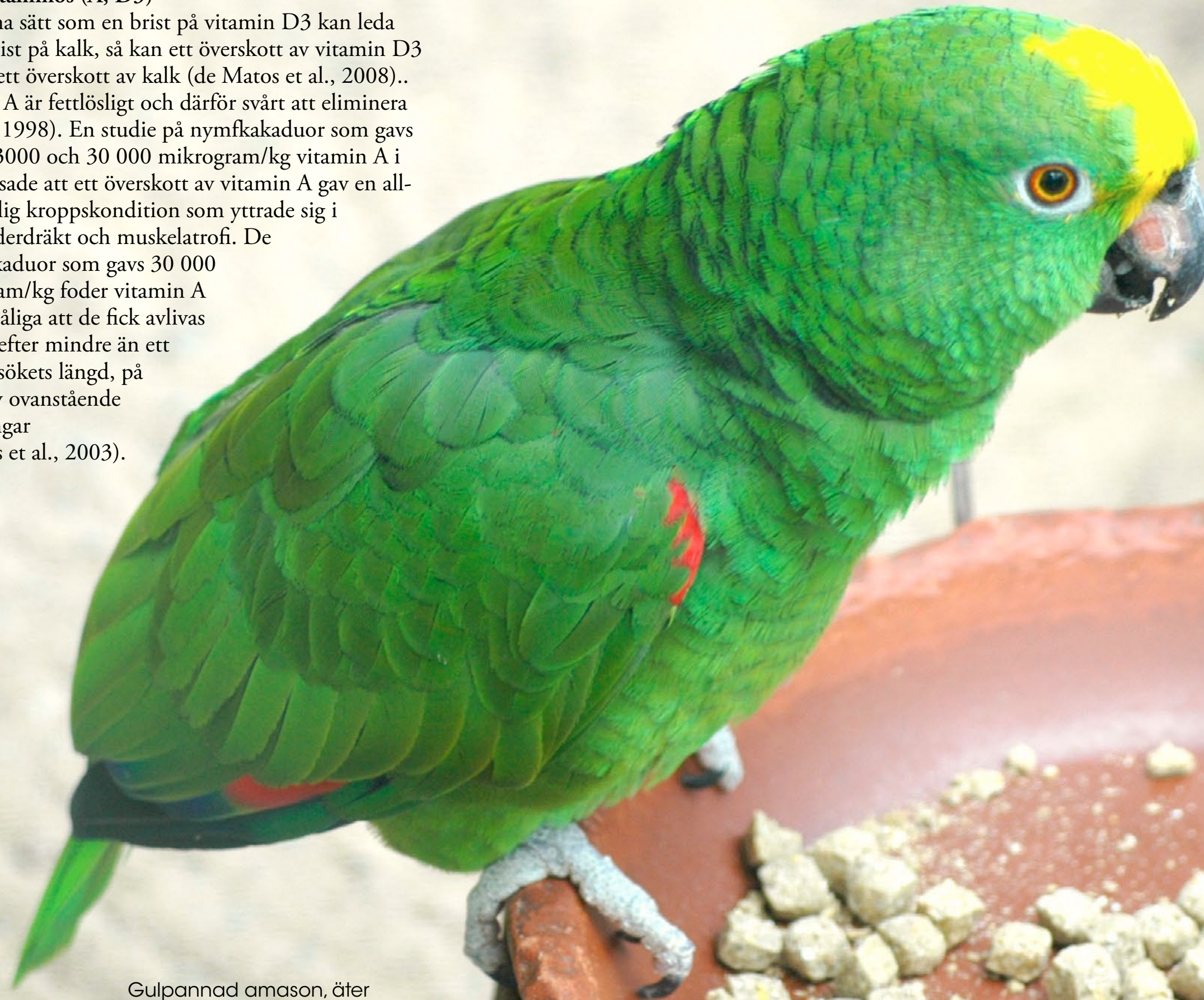
Gulpannad amason, äter pellets, ett balaserat lämpligt foder

På samma sätt som en brist på vitamin D3 kan leda till en brist på kalk, så kan ett överskott av vitamin D3 leda till ett överskott av kalk (de Matos et al., 2008).. Vitamin A är fettlösligt och därför svårt att eliminera (Forbes, 1998). En studie på nymfkakaduor som gavs 0, 600, 3000 och 30 000 mikrogram/kg vitamin A i fodret visade att ett överskott av vitamin A gav en allmänt dålig kroppskondition som yttrade sig i dålig fjäderdräkt och muskelatrofi. De nymfkakaduor som gavs 30 000 mikrogram/kg foder vitamin A blev så dåliga att de fick avlivas i förtid, efter mindre än ett år av försökets längd, på grund av ovanstående anledningar (Koutsos et al., 2003).