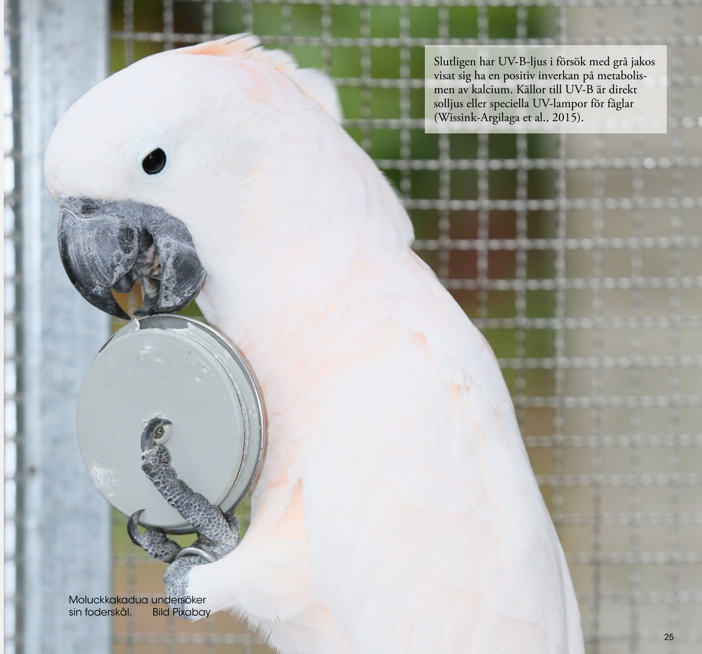
Moluckkakadua undersöker sin foderskål.

Med en ökande andel pellets i dieterna ökade kalcium-fosfor-kvoten. Denna var högst för (75% pellets och 25% färsk föda) och (100% pellets), där den låg på omkring 1,35:1. De övriga två dieterna nådde inte rekommendationen (Brightsmith, 2012). I ytterligare en studie av Ullrey et al. introducerades ett par av fem olika arter (grönvingad ara, gulhuvad amazon, orangetofskakadua, moluckkungspapegoja, svarthättad rosella) till en diet med en högre och högre mängd pellets under 2-3 dagar. Slutligen bestod torrsubstansen i deras diet till över 80% av pellets, och ingen brist på näringsämnen observerades. Färsksubstansen bestod till över 60% av frukt och grönsaker, och Ullrey et al. föreslår att de består av en så stor del vatten att de inte påverkar näringsinnehållet i den totala dieten så mycket (Ullrey et al., 1991).