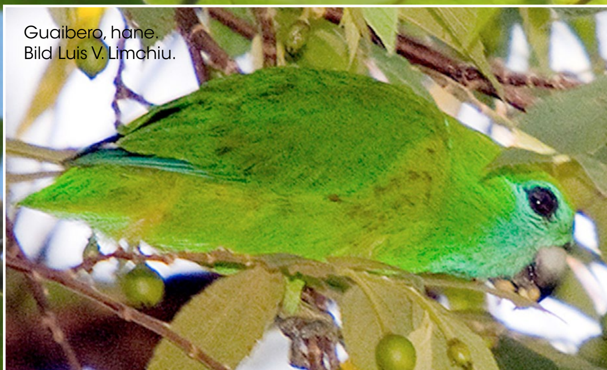
Guaibero, hane.

När det gäller papegojorna fann projektet att stora arter saknades på de flesta undersökta platser som till synes hade intakt livsmiljö, och även där stora papegojor fanns hade de lägre densitet än besläktade arter i liknande miljöer i sydostasien. Till exempel har den gröna racketstjärten ( Prioniturus luconensis ) endast observerats på sju av 29 historiska platser under de senaste tio åren.