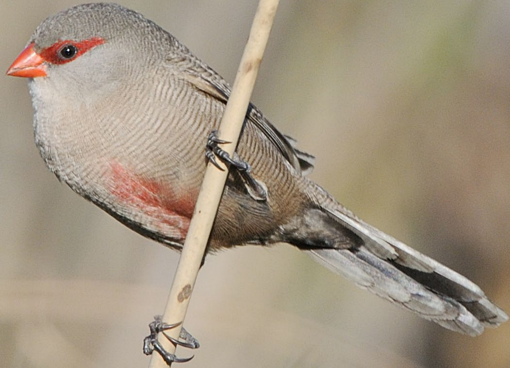
St. Helenaastrild.

Hemma hos mej var det Mozambiksiskorna, tigerfinkarna, pärlhalssamadinerna och silvernäbbarna som stod för skönsjungandet. Dock lät hanarna av St. Helena höra en liten omväxlande sångstrof, något njutbar, men inte särskilt vacker.